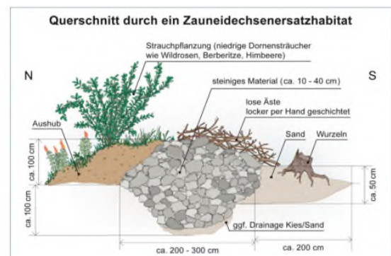
Prinzipskizze eines Zauneidechsenersatzhabitats, Quelle: Arbeitshilfe Zauneidechsen, LFU 2020

Die Anlage der zwei Ersatzhabitats ist innerhalb der externen Ausgleichsfläche „Streuobstwiese nördlich / nordöstlich des Plangebiets“ auf den Grundstücken Fl.St.Nrn. 1907 und 1915 zu realisieren. Die Ersatzhabitats sind nördlich der neu zu pflanzenden Obstbäume anzulegen.